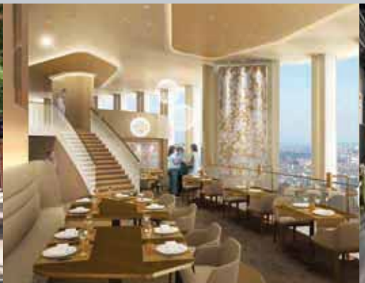
Le restaurant du Radisson Blu Hotel Lyon