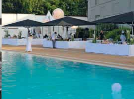
La piscine de l'Hôtel Lyon Métropole