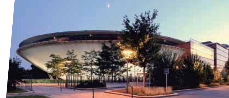
Le Centre de Congrès

Centre de Congrès l'Espace Tête d'Or : à deux pas du parc et de la gare de la Part-Dieu, un plateau modulable de 2 400 m 2 dédié aux réunions complété au premier étage par 6 salles de commission.