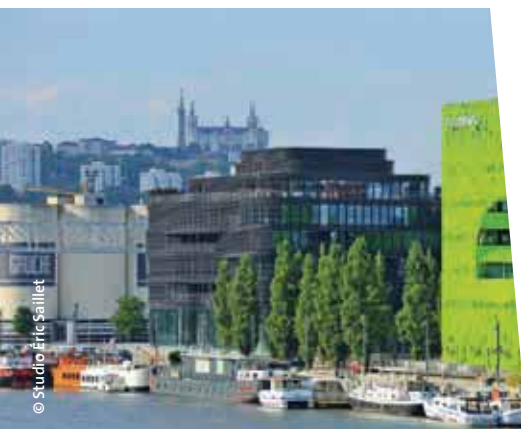
La rive de Lyon Confluence