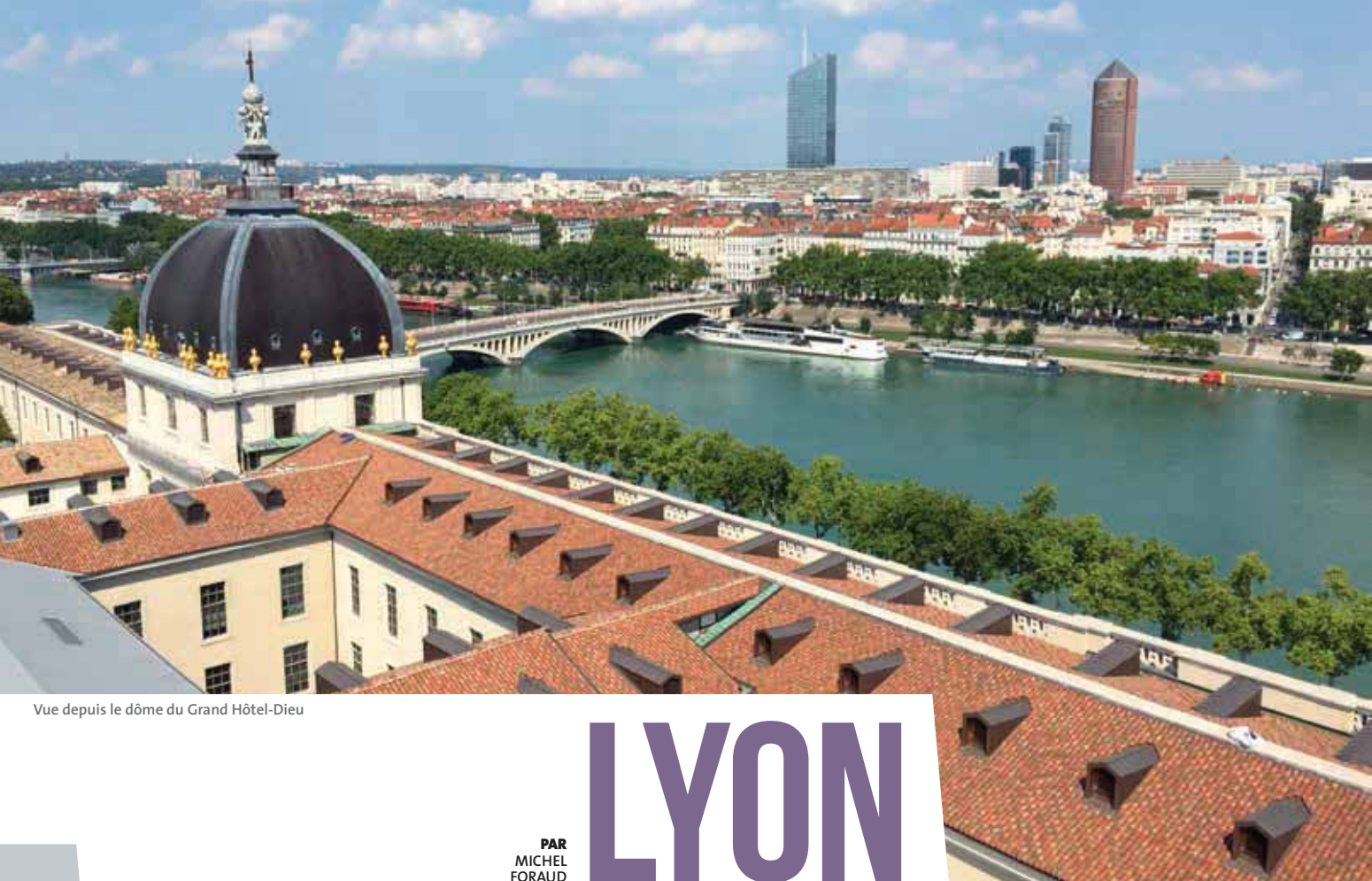
Vue depuis le dôme du Grand Hôtel-Dieu