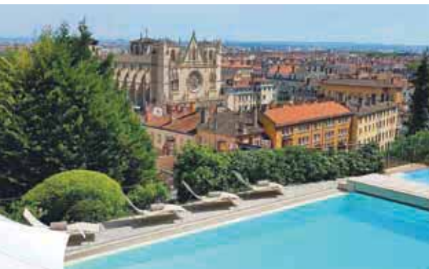
La piscine de la Villa Florentine