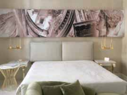
Une chambre du Boscolo Exedra Lyon