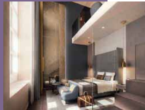
Chambre duplex de l'InterContinental