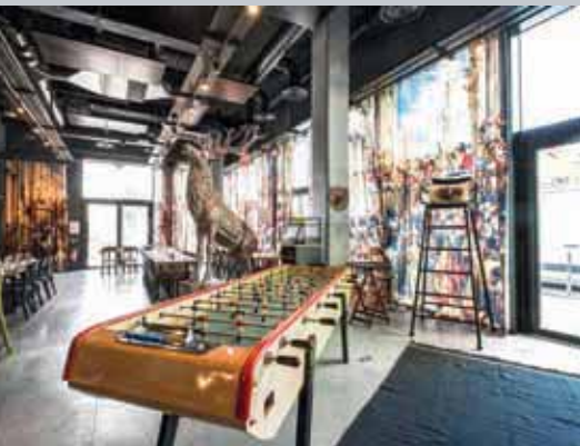
Le Mob Hotel