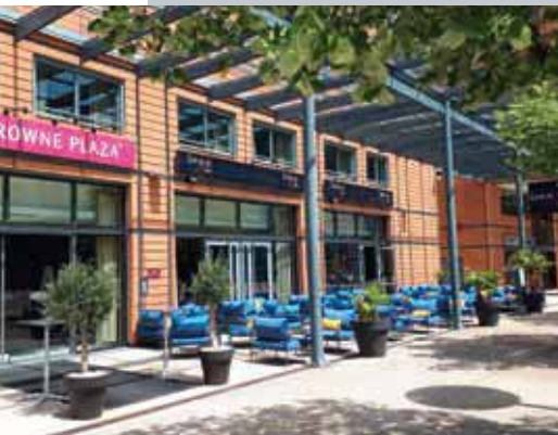
La terrasse du Crowne Plaza

Train : 25 liaisons quotidiennes la relie à Paris, liaisons également vers Bruxelles et Londres.