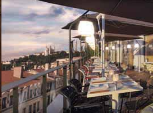
Le rooftop de la Maison Nô