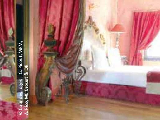
Une chambre vénitienne de La Cour des Loges