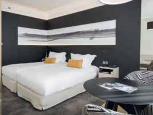
Une chambre de luxe au Marriott