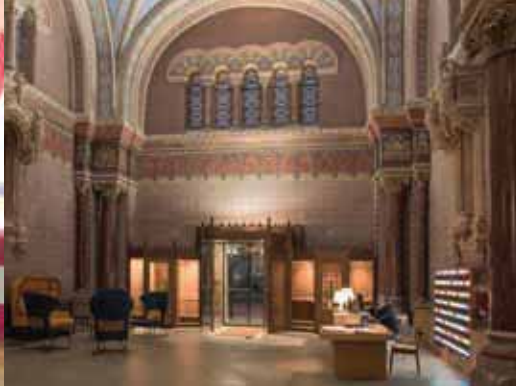
La réception de l'Hôtel Fourvière