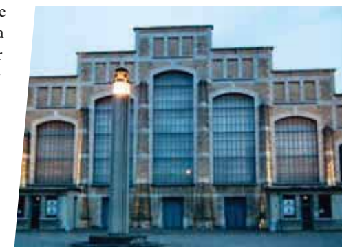
La Halle Tony Garnier